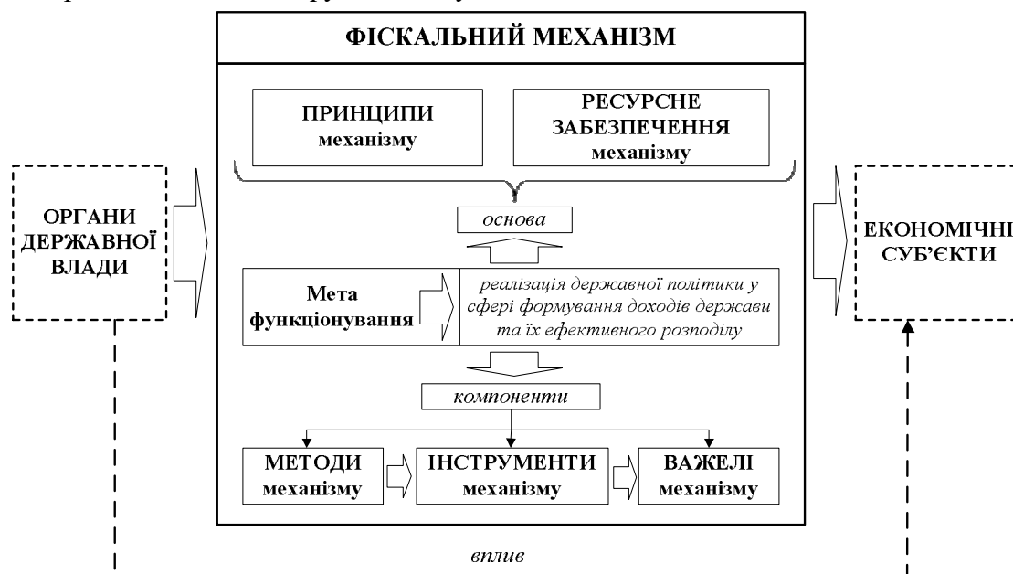
Рис. 1. Модель фінансового механізму

Відповідно, як вже зазначалося, фінансовий механізм складається з певних структурних компонентів, які пов'язані між собою та в сукупності мають здатність впливати на економічні процеси в країні, розподіл та перерозподіл ВВП (рис. 1). Особливу роль у такій структурі відіграють фінансові інструменти. Саме їх склад, види та особливості використання і дозволяють покращити частково роботу окресленого механізму, забезпечити ефективність його роботи в сучасних умовах. Сукупність фінансових інструментів не є сталою, а їх кількість постійно змінюється залежно від економічного розвитку, виникнення нових видів фінансових відносин у країні. Саме така трансформаційна сутність окреслених типів інструментів обумовлює також важливість їх вивчення.