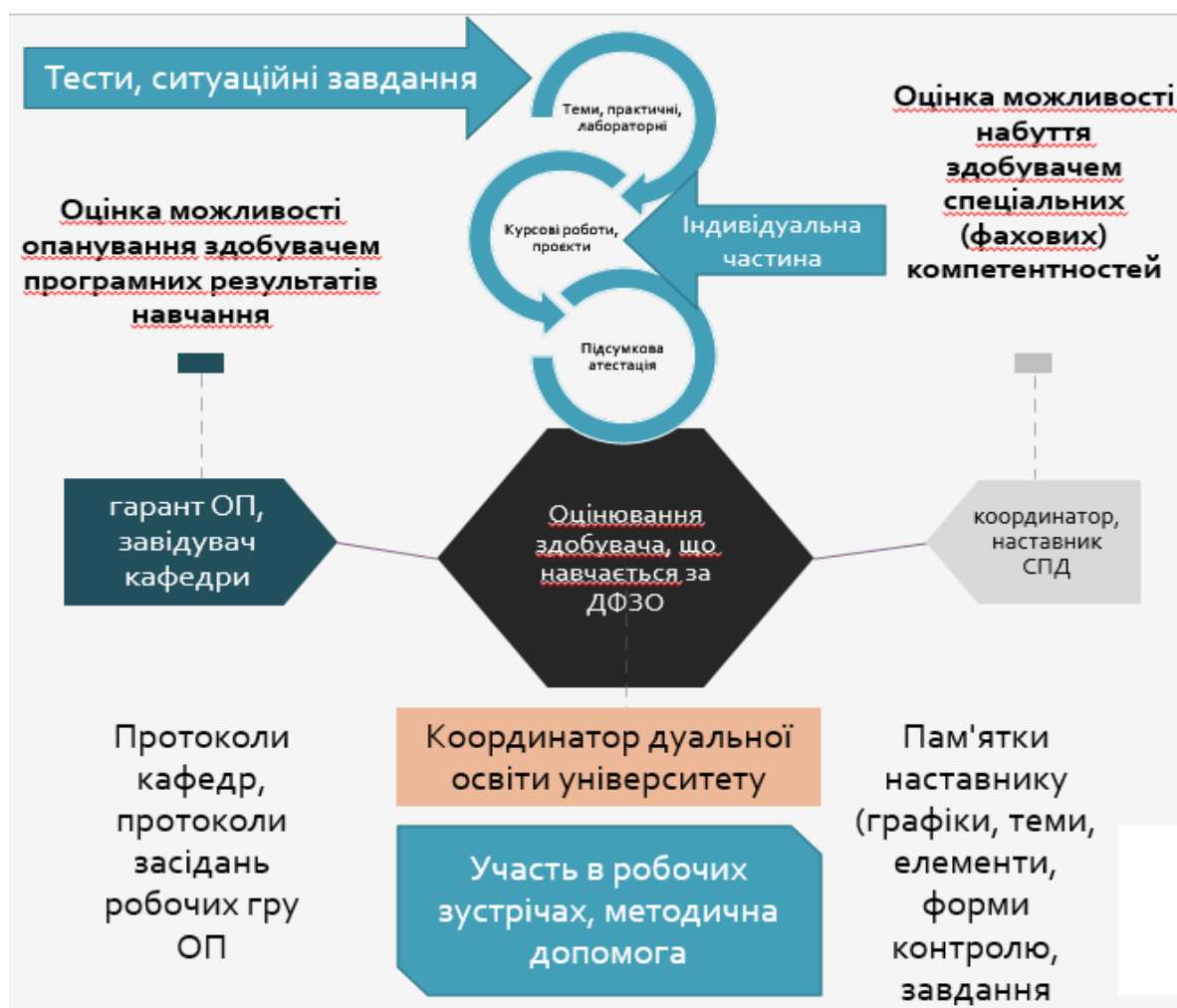
Рис. 1 Робоча схема координації та оцінювання навчальних елементів, що

Щоб реалізувати дуальні процеси навчання практично, підприємство, якому потрібні фахівці, укладає договір із ЗВО про наміри, договір між студентом та роботодавцем, тристоронній договір між студентом, роботодавцем та ЗВО. Окремою частиною є формування індивідуального плану навчання здобувача з виокремленням частини, що буде опрацьовано на підприємстві. В цьому контексті основним принципом вибору елементів тем по кожній з дисциплін ОП, що передаються на освоєння на підприємстві є врахування максимально можливого врахування потреб СПД і вимог до компетентності працівника з боку роботодавця, але з врахуванням необхідності досягнення програмних результатів навчання без шкоди для загальнотеоретичної підготовки здобувачів. Схематично координація та оцінювання навчальних елементів, що передаються на для освоєння здобувачем вищої освіти на фірмі (підприємстві, установі, організації, у СПД-фізичної особи) представлена на рис.1. передаються на для освоєння здобувачем вищої освіти на фірмі (підприємстві, установі, організації, у СПД-фізичної особи).