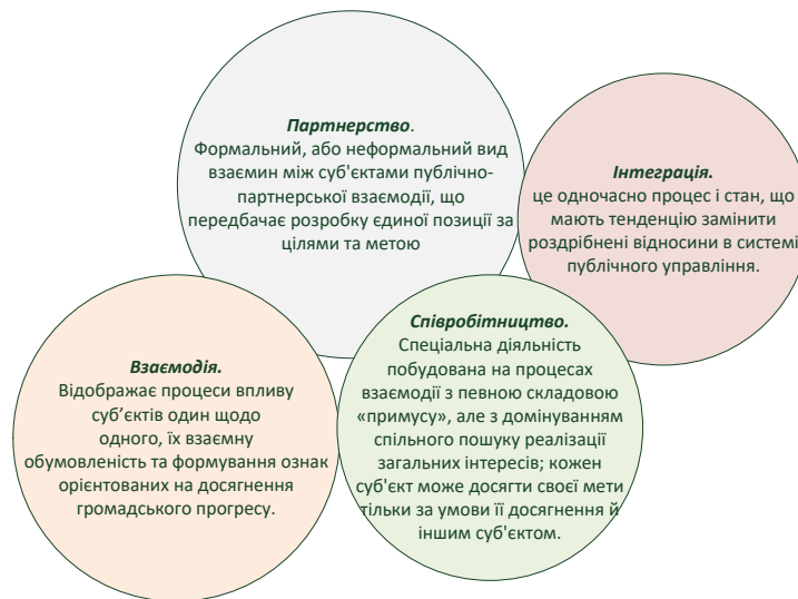
Рис. 1. Основні поняття, що розкривають зміст публічно-партнерської взаємодії

У своїй статті Т. Коваль та В. Яхкінд [4] зазначають, що «партнерство – це вид взаємин між різними суб'єктами, який полягає у формуванні єдиної позиції з певних питань та організації спільних дій». Узагальнення сукупності основних понять, що аналізуються, представлено на рис. 1.