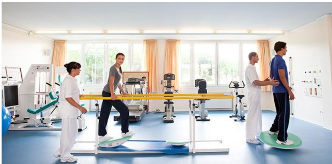
Рис. 3.3. Спортивна реабілітація