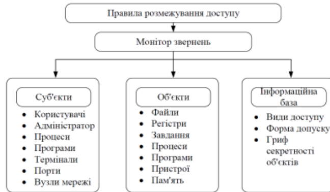
Рис. 3. Структура монітору звернень

Практичне створення монітору звернень, як видно з наведеного рисунку, передбачає розробку конкретних правил розмежування доступу у вигляді так званої моделі захисту інформації.