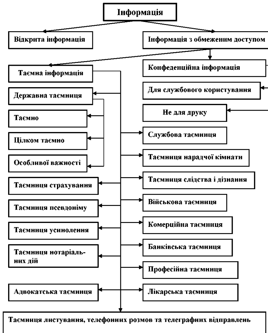
Рис. 4. Класифікація інформації у відповідності до Закону України «Про інформацію»

В ст.10 Закону України «Про основи національної безпеки України», визначені основні функції суб'єктів забезпечення національної безпеки України (інформаційна сфера окремо не виділена):