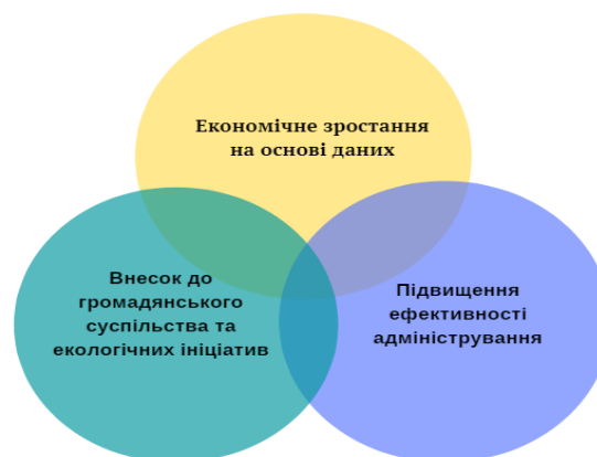
Рис. 2. Додана вартість відкритих даних у трьох основних областях.

Відкриті дані спроможні створювати додаткову вартість, яку найкраще можна проілюструвати, зосередившись на трьох основних областях: