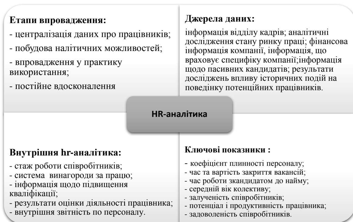
Рис. 2. Етапи впровадження, джерела даних та ключові показники HR-аналітики

Ще один важливий аспект інноваційної системи управління талантами – акцент на різноманітності та інклюзії. Різноманітність, яка є вродженою або набутою, а також очевидною та прихованою, охоплює ряд аспектів, таких як стать, раса, вік, інвалідність, сексуальна орієнтація, різноманітність, цінність, культурні коди тощо. Інклюзивність включає побудову корпоративної культури, яка цінує та підтримує різноманітність. В інклюзивній культурі працівники мають почуття безпеки, належності та визнання, а також великі можливості для самореалізації.