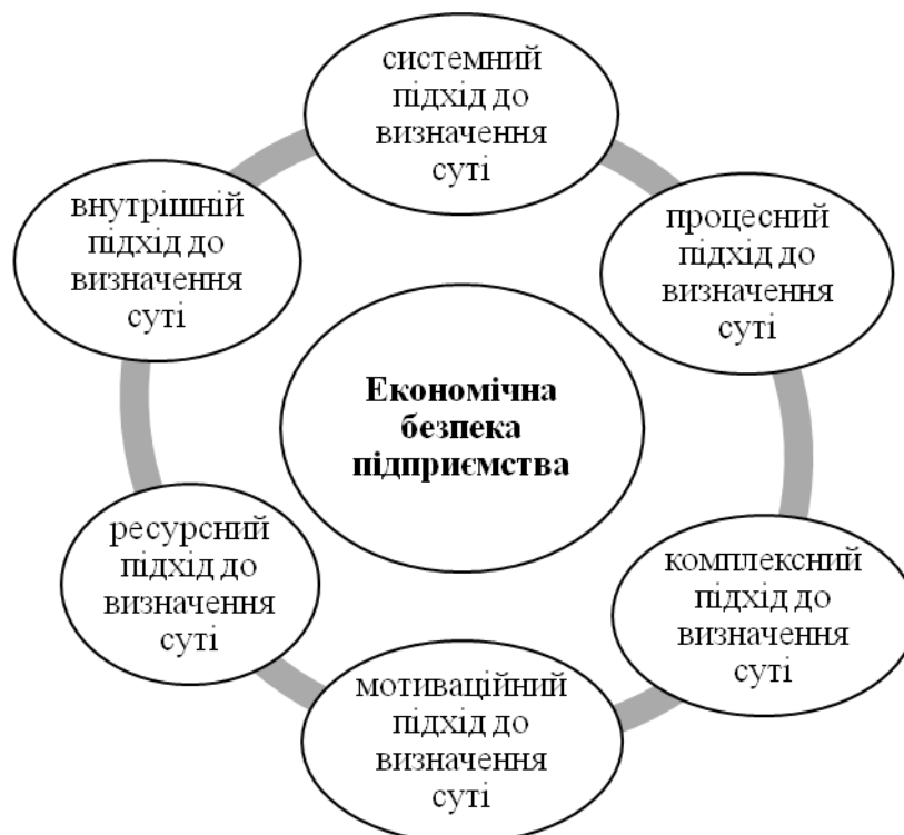
Рис. 1. Підходи до визначення суті поняття «економічна безпека підприємства»

ресурсно-орієнтованим підходом, економічна безпека підприємства має гарантувати збереження й оптимальне використання його ресурсів. Мотиваційний підхід ґрунтується на забезпеченні економічної вигоди в розвитку зацікавлених сторін і підприємств у майбутніх періодах.