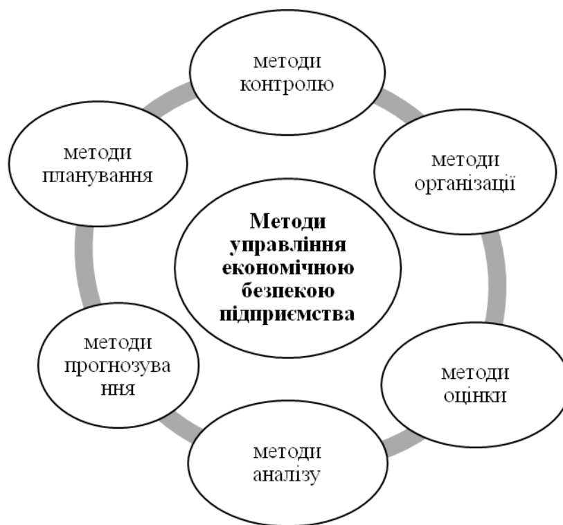
Рис. 4. Методи управління економічною безпекою підприємства

загрози бізнес-середовища; мати високий рівень гнучкості управління; відобразити практичну реалізацію стратегічних, тактичних заходів та оперативних дій із забезпечення економічної безпеки; мати високу ефективність реалізації прийнятих управлінських заходів і стимулювати зацікавленість всіх відповідальних осіб у забезпеченні високого рівня економічної безпеки.