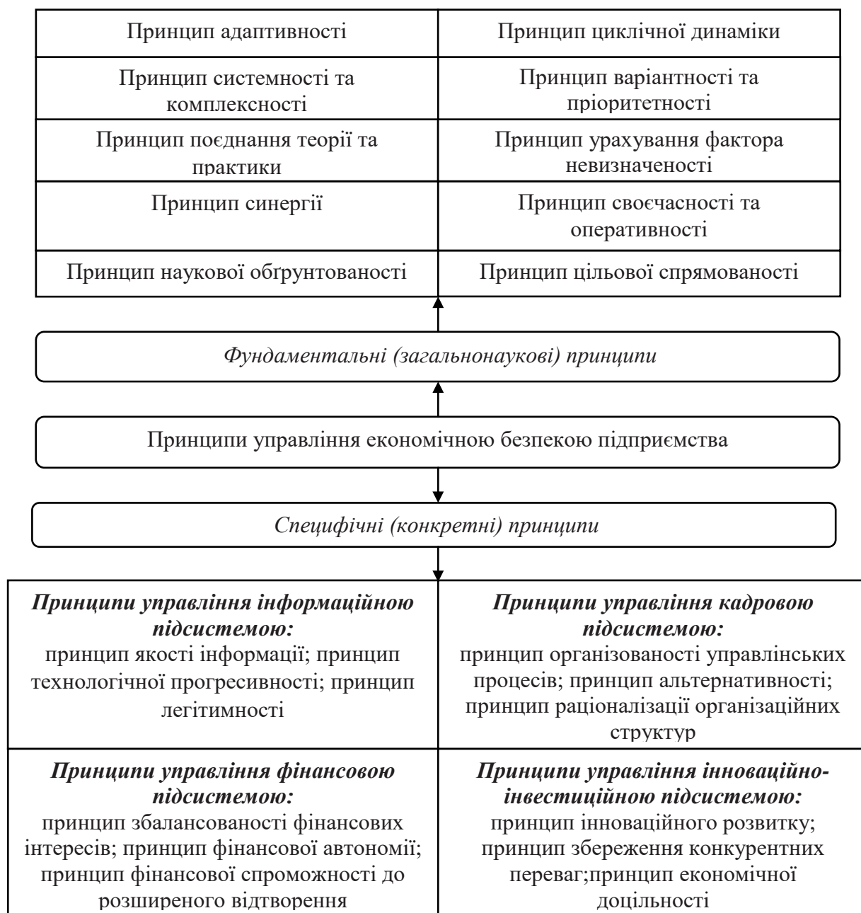
Рис. 2. Принципи управління економічною безпекою підприємства Джерело: [12, с. 208]

Наступним елементом методологічного базису управління економічною безпекою підприємства є принципи – інструментальне підґрунтя, основні правила та вихідні положення процесу. Повнота і правильна обґрунтованість принципів управління забезпечують максимальну вірогідність досягнення поставленої мети. Системи принципів класично має дворівневу структуру і складається із фундаментальних (загальнонаукових) і специфічних (конкретних) принципів та наведена на рис. 2. Фундаментальні принципи мають загальнонауковий характер і можуть бути методологічною основою будь-якого процесу або діяльності, оскільки вони визначають універсальні властивості, що формуються на філософському рівні. З огляду на це, кожне наукове знання на основі застосування загальнонаукових принципів будує власну методологію, характер якої залежить від специфіки її змісту. Принципи управління є узагальненням об'єктивних законів, які визначають організаційну структуру організації, характер взаємодії між її суб'єктами та об'єктами в процесі управління, взаємодію із зовнішнім середовищем тощо.