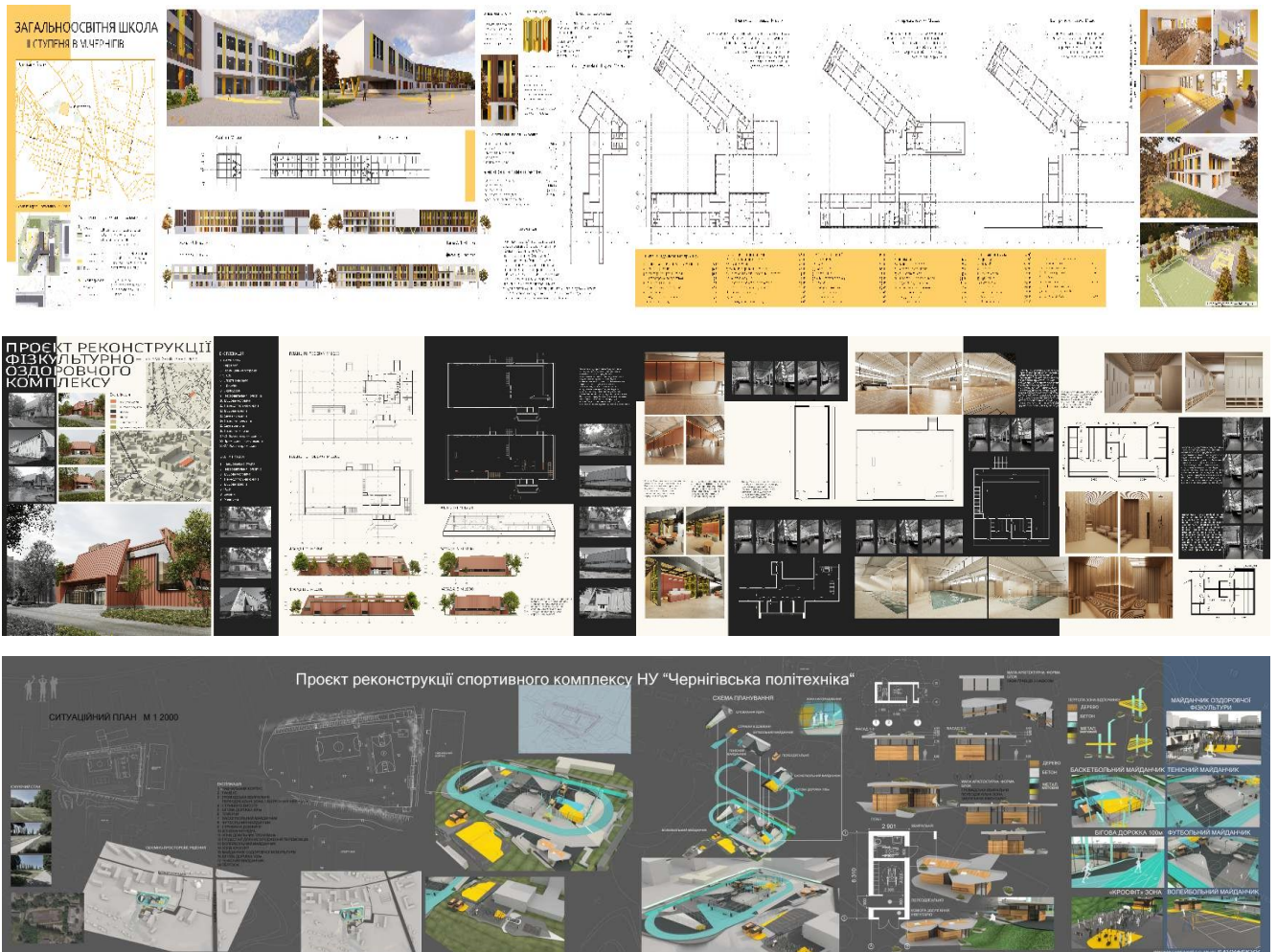
Рис. 2 – Приклади КР