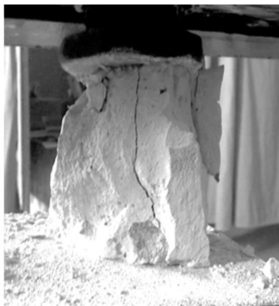
Рис. 6. Механічне випробування цегляних зразків

Міцнісні характеристики досліджуваних зразків визначали за допомогою випробування кубиків на стиск укладених на постіль та ложок за допомогою пресового обладнання (рис. 6). Було проведено три серії випробувань по п'ять цеглин у кожній, тобто загалом 40 кубиків.