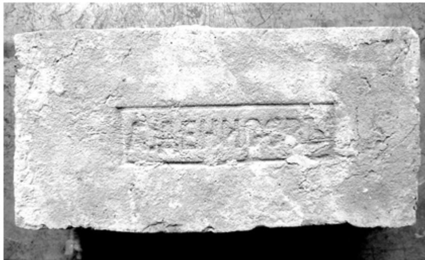
Рис. 3. Старовинна глиняна цегла з клеймом «А. Денисовъ»