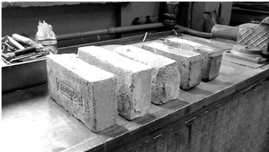
Рис. 2. Зразки відібраної цегли з кожної партії

Особливий інтерес викликає найстарша цегла з клеймом «А. Денисовъ» (рис. 3). Буква «Ъ» на кінці дає нам підставу вважати, що ця цегла була зроблена ще до орфографічної реформи 1917–1918 років.