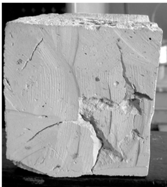
Рис. 5. Дефекти внутрішньої структури старовинної цегли

Повторні ультразвукові випробування не показали суттєвих змін у швидкості проходження механічних коливань після різання зразків.