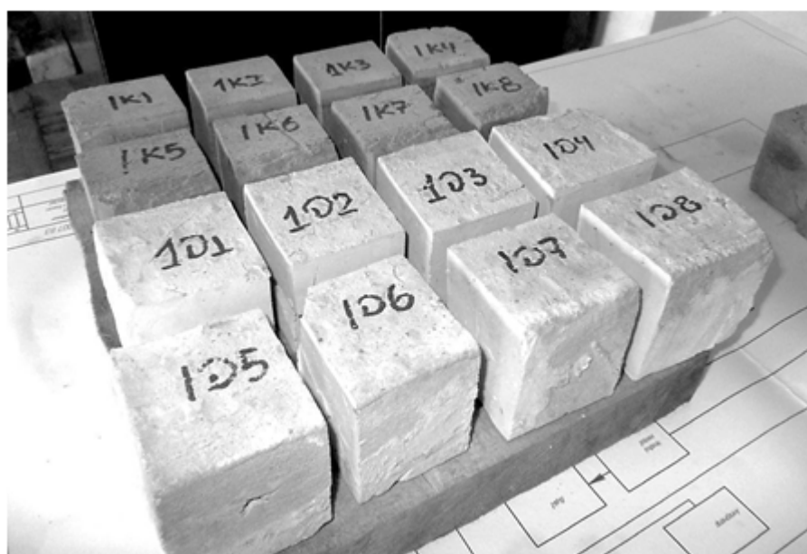
Рис. 4. Розташування фрагментів зразків перед механічним випробовуванням

Для подальшого проведення механічного випробовування на міцність усі досліджувані зразки за допомогою алмазного диска були розпилені на 8 окремих зразків розмірами 60 \times 60 \times 60 мм, що максимально наближено до ГОСТ 8462–85. Розташування зразків один щодо іншого не порушувалося (рис. 4).