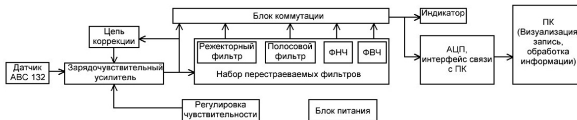
Рис. 1. Блок-схема аппаратных средств снятия и обработки вибрационных сигналов

Изложение основного материала. Для этой цели была использована аппаратура, разработанная в лаборатории диагностики Одесского национального политехнического университета, блок-схема которой представлена на рис. 1.