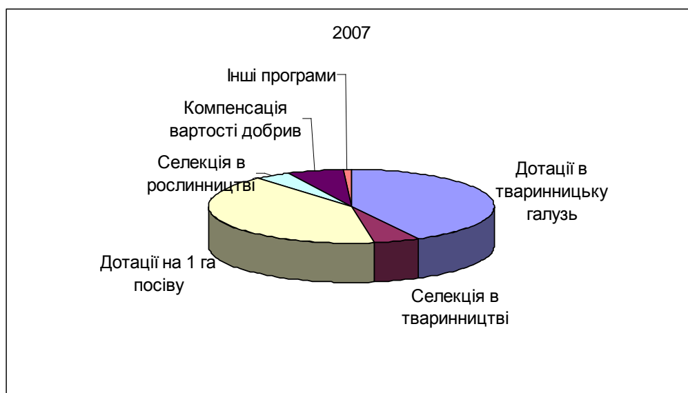
Рис. 2. Розподіл бюджетних коштів за програмами сільгосподотаций в Україні

Розподіл коштів за програмами сільськогосподарських дотацій в Україні на 2007 р. відображено на рис. 2. Як видно з представленої діаграми, найсуттєвішою статтею видатків на АПК є дотації в рослинництво й тваринництво.