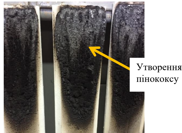
Рис. 1 – Випробування групи горючості деревини